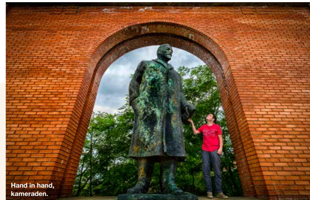
Hand in hand, kameraden.

aan het ontbijt. Het is de vorige avond laat geworden want op die ene Pálinka volgden heel wat biertjes bij één van de vele ruïnebars die Boedapest rijk is. Ruïnebars zijn exact wat de naam al zegt, bars opgezet in leegstaande panden en ruïnes. Het is er altijd gezellig, de Hongaarse vrouwen zijn schitterend en de halve liters bier zijn er met een prijs van omgerekend 1,30 euro per glas spotgoedkoop. Zo goedkoop dat we deze ochtend met zijn drieën de tol vol betalen met een bonkende kater in het hoofd. Het ontbijt doet echter wonderen. Dus maken we ons redelijk fris op voor de volgende bestemming: Memento Park. Het park, in het uiterste zuiden van Boedapest, is een grote beeldentuin met overblijfsels uit de Sovjettijd. Er staan bronzen beelden van Lenin en Stalin, maar ook van enkele tientallen Hongaarse communisten. Het zijn