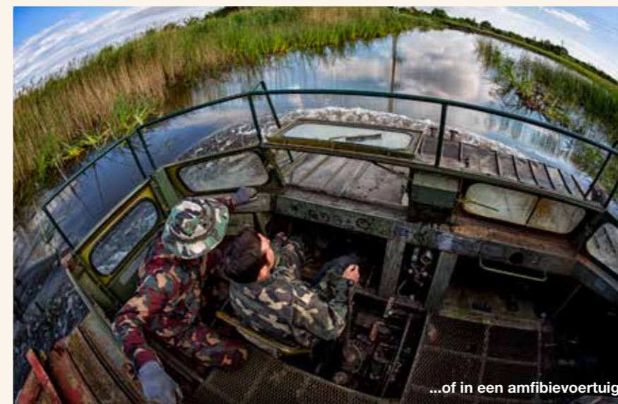
...of in een amfibievoertuig.