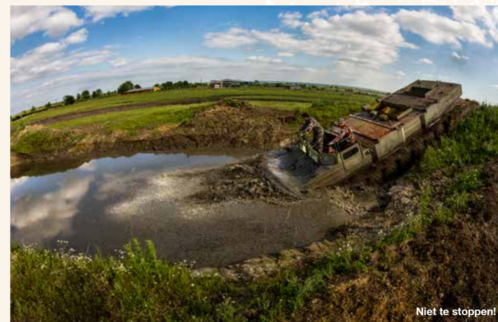
Niet te stoppen!

's Avonds zitten we weer op het terras bij één van de vele ruïnebars. We drinken een Pálinka, gewoon omdat het kan, en een biertje. Ze smaken naar meer. Maar dat doen andere dingen in Hongarije ook. De Trabant-rit, de tankrit, die smaakten pas écht naar meer. Hongarije, wat een land! ●